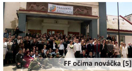
FF očima nováčka [5]