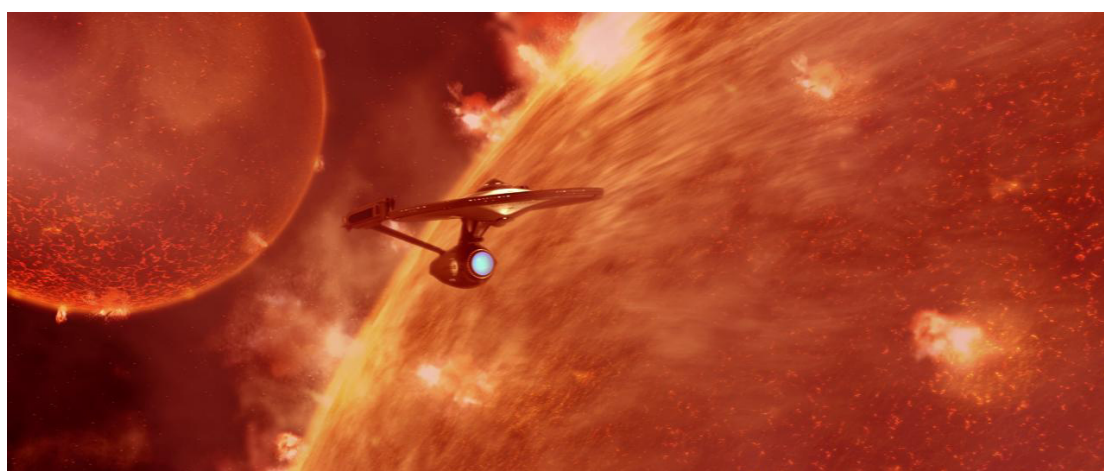
When Worlds Collide